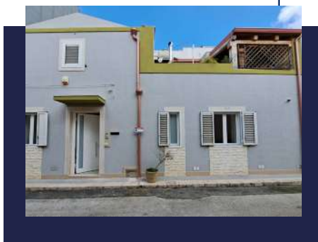
ALTRI IMMOBILI VENDUTI